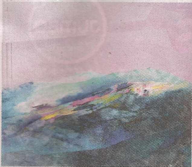
Espacio Cachi, de Horacio Pagés Frascara.