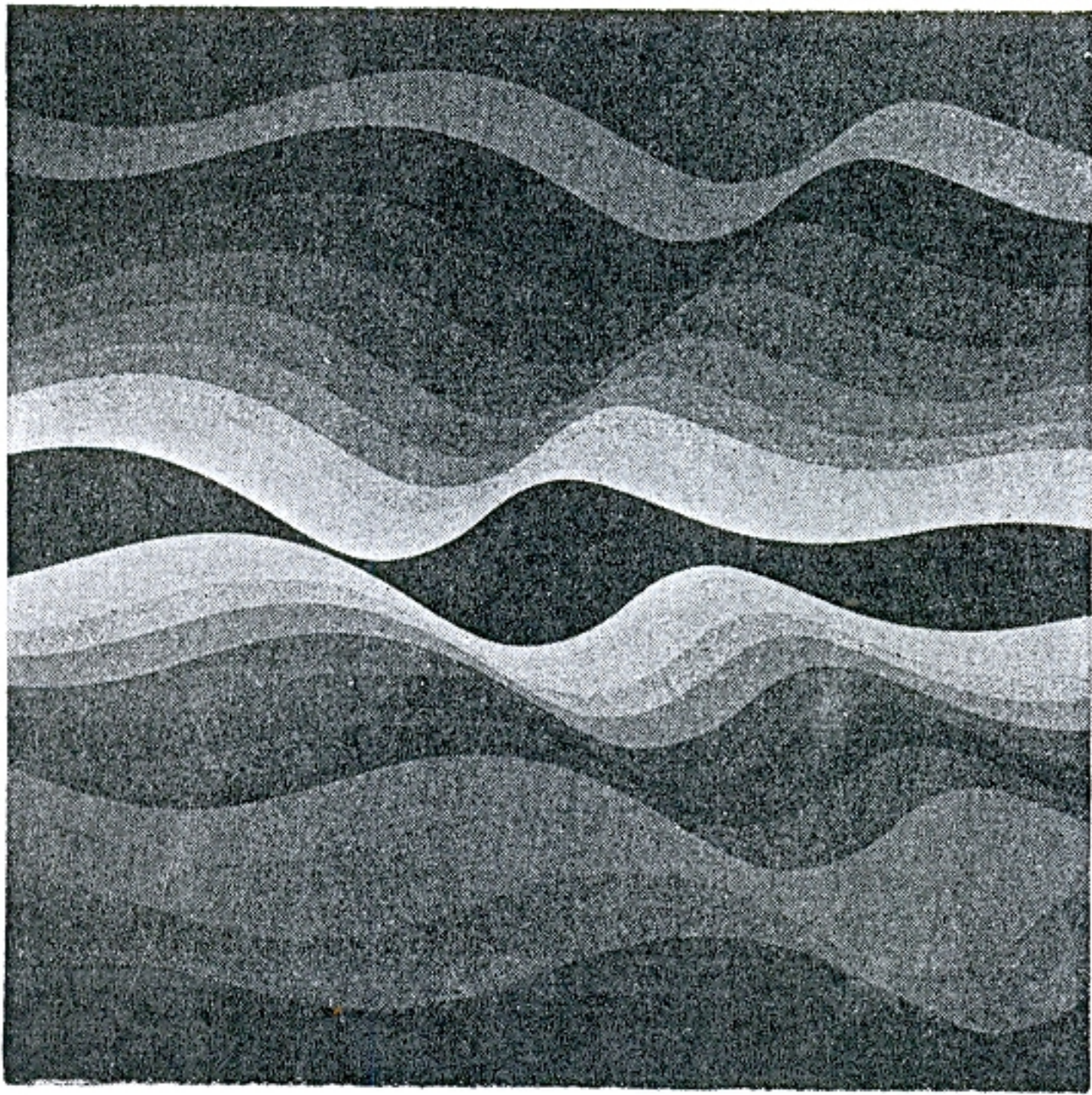
De la serie Sol-Luna