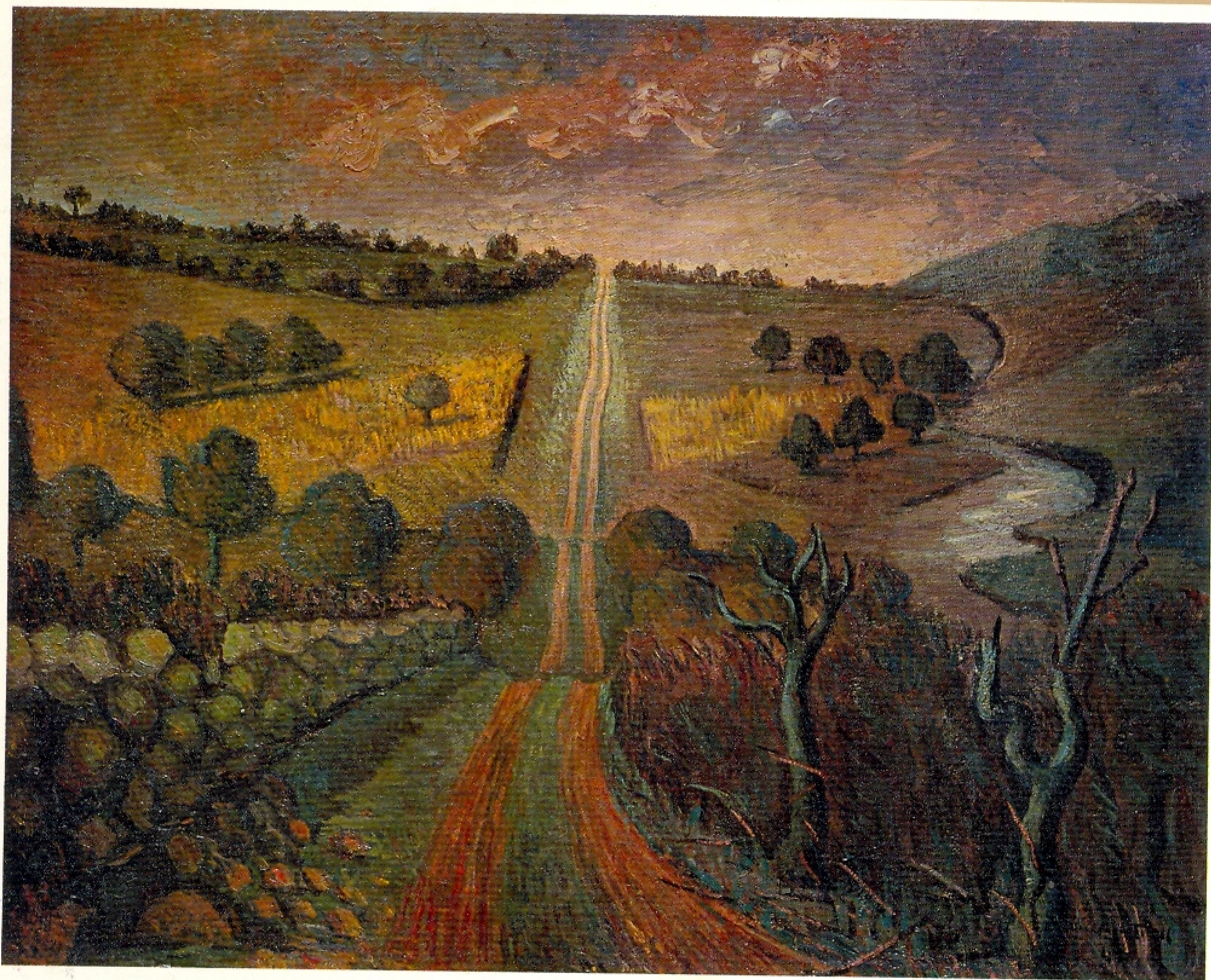
El Camino, óleo, 1949

MUSEO PROVINCIAL DE BELLAS ARTES DE SALTA